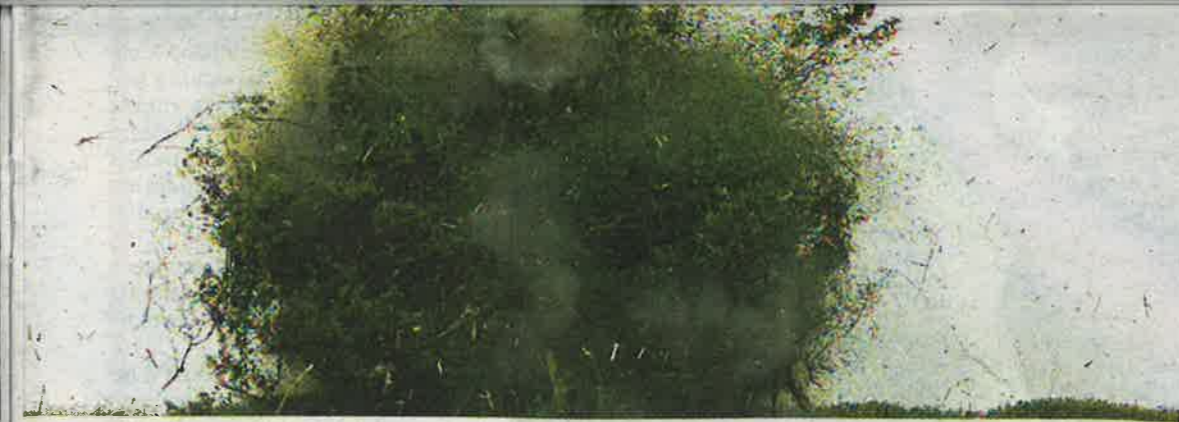
Henrik Håkanssons flerkanaliga videoinstallation registrerar sprängningen av ett ensamt träd i olika fördröjda hastigheter. Bild: Henrik Håkansson

” Till installationen hör också ett furiöst performance, som rör sig mellan noisemusik och aktionism